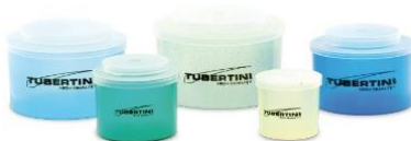
MATRIOSKE PER ESCHES